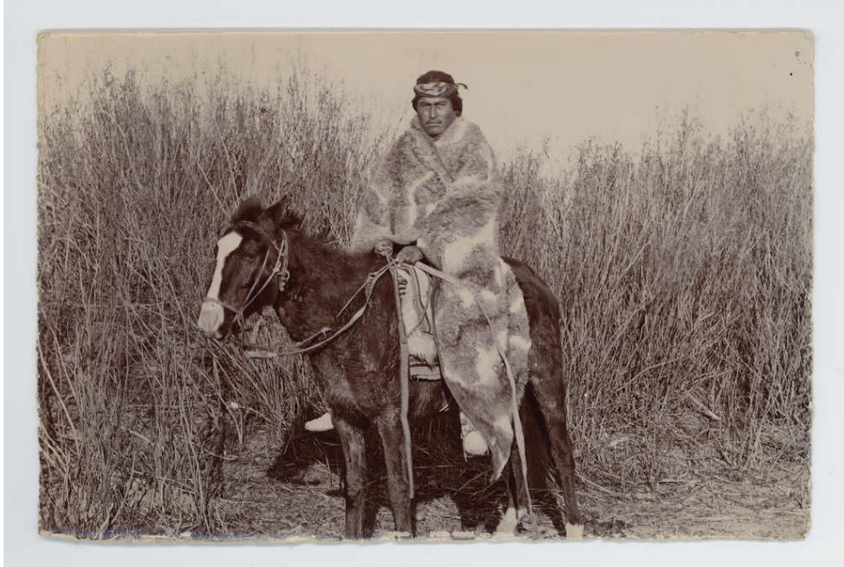
Un o frodorion Patagonia yn gwisgo mantell o grwyn gwanacod

Yn y 1880au, rhagfynegodd Michael D. Jones ddifodiant llwyth y Tehuelche, gan ddadlau mai trwy gydymffurfio â dulliau ymsefydlu'r Ewropeaid yn unig y byddai ganddynt unrhyw obaith o oroesi: