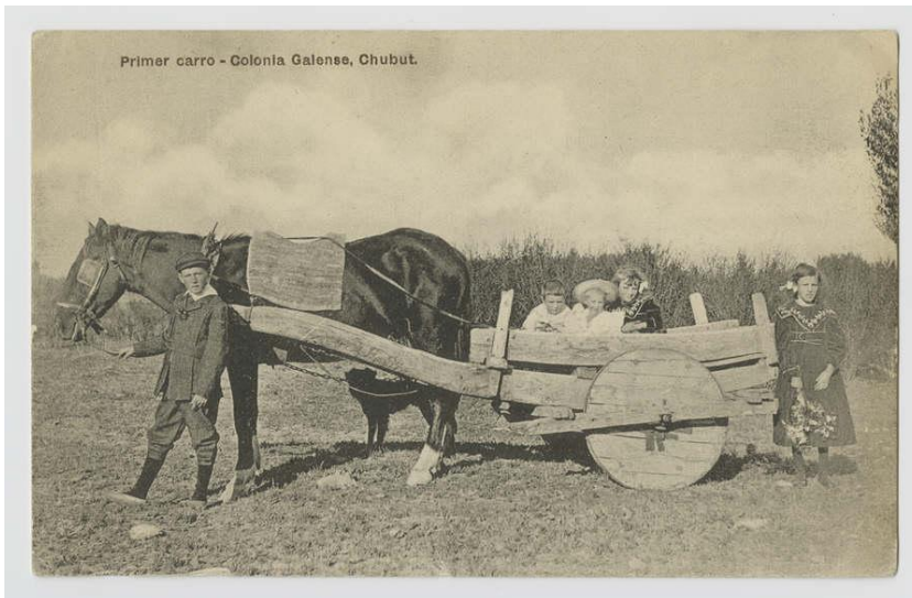
Cerdyn post o'r drol gyntaf yn y Wladfa, c.1866

Ysgrifennwch ddarn creadigol i ddisgrifio'r hyn a welwch yn y ffotograff.