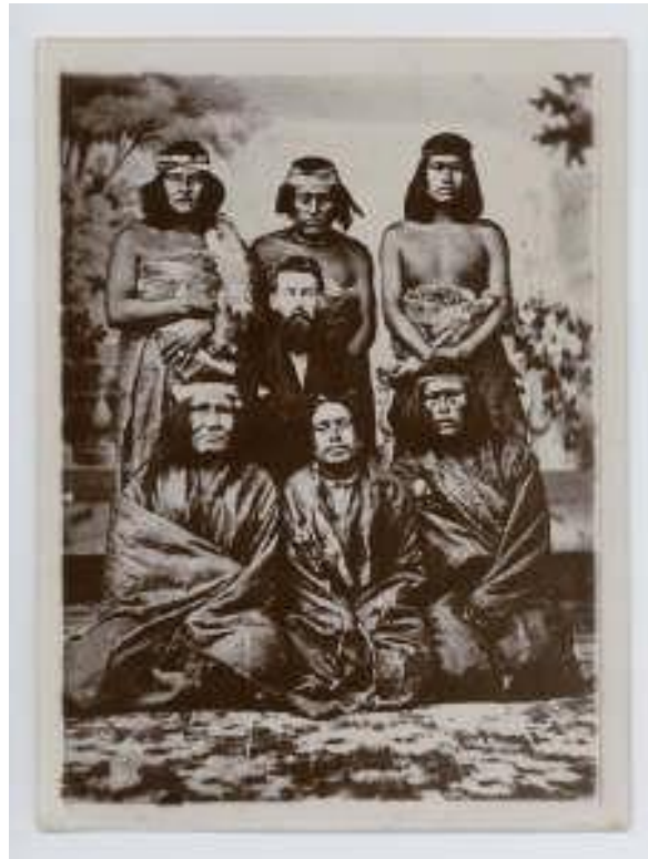
Lewis Jones (1836-1904) ymhlith Tehuelches, c.1867

Roedd y trefnwyr yn gwybod am fodolaeth y llwythau hyn cyn i'r fintai gyntaf o Gymry hwylio i Batagonia, er nad oedd sicrwydd sut fath o bobl oeddynt. Pwysleisiai Michael D. Jones y dylid trin brodorion Patagonia gyda phob tegwch a'u cydnabod fel perchnogion y tir. Cyfeiriai yn arbennig at yr esiampl a ddangoswyd gan William Penn ym Mhennsylvania yn yr ail ganrif ar bymtheg. Ym 1683 gwnaeth Penn gytundeb gyda brodorion Gogledd America na fyddai'r naill ochr yn defnyddio trais yn erbyn y llall. Dadleuai Michael D. Jones y dylai'r Cymry ymddwyn tuag at brodorion Patagonia yn yr un modd.