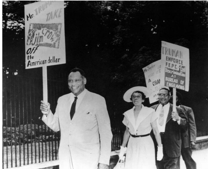
Robeson on an anti-segregation march, 1948