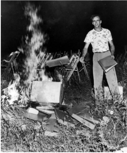
Terfysg Peekskill, 1949