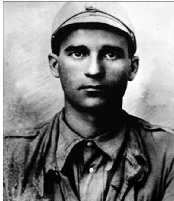
Rhaglen y Cyfarfod Coffa Cenedlaethol, 1938