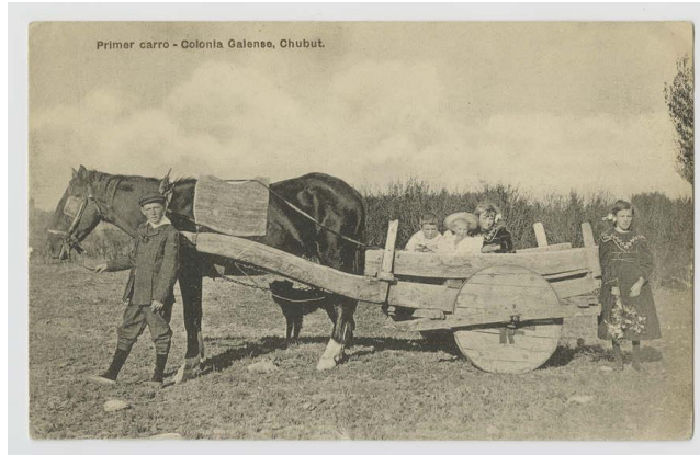
Cerdyn post o'r drol gyntaf yn y Wladfa, c.1866