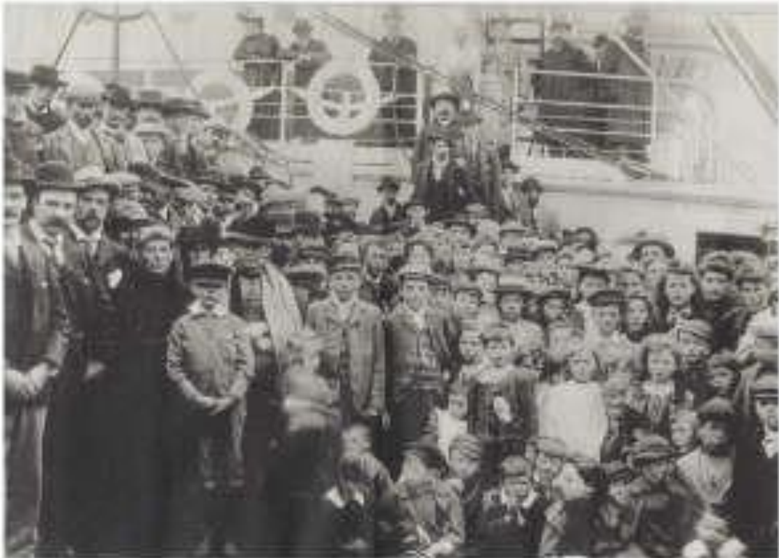
Rhai o Gymry Patagonia ym mhorthladd Lerpwl ar fwrdd y stemar 'Numidian' ar eu ffordd i Canada (llungopi o ffoto)

I goroni'r cwbl, cafodd Dyffryn Camwy ei daro ym 1899 gan y llifogydd gwaethaf ers i'r Cymry ymsefydlu yno ym 1865. Yn ôl adroddiadau ar y pryd, bu'n bwrw glaw yn Nyffryn Camwy am dros dair wythnos, gan achosi i lefel yr afon godi ar gyfradd o bymtheg modfedd pob deuddeng awr. Difrodwyd cartrefi ac eiddo'r ymsefydlwyr a bu'n rhaid iddynt ffoi i dir uwch er mwyn diogelwch. Ni chollwyd unrhyw fywydau, ond dinistriodd y llifogydd dros gant o dai, wyth capel, pum ysgoldy a thri llythyrdy. Casglwyd miloedd o ddoleri yn Buenos Aires er mwyn rhoi cymorth i'r gwladfawyr, ond wedi i Afon Camwy orlifo deirgwaith eto, dechreuodd nifer ohonynt deimlo nad oedd dyfodol iddynt ar dir Patagonia.