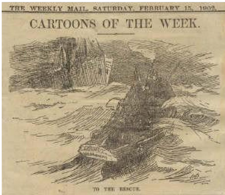
Cartŵn ynghylch ymadawiad nifer o Gymry'r Wladfa i Canada, 1901-2