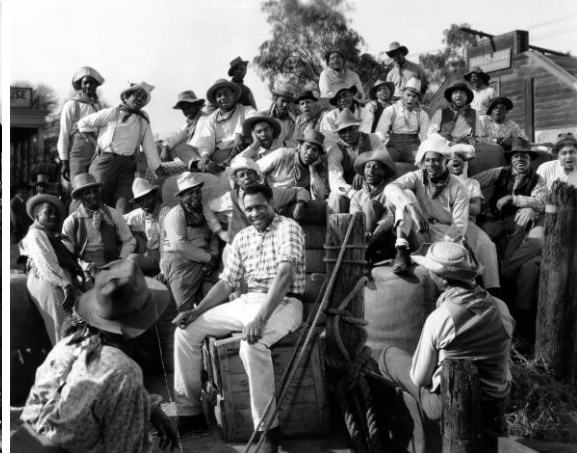
Cast Showboat, 1928

Roedd cynnydd a dylanwad y sinema ar gynulleidfaedd yn cynnig cyfle i Paul Robeson gyfuno'i wleidyddiaeth â'i ddoniau artistig. Rhoddodd gyfle iddo gysylltu â chynulleidfa ffilmiau oedd yn tyfu'n gyflym.